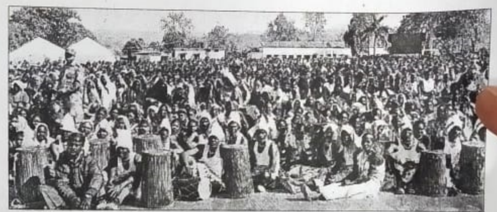
लातेहार में रविवार को आयोजित विधिक जागरुकता सह सशक्तीकरण शिविर में मौजूद ग्रामीण।