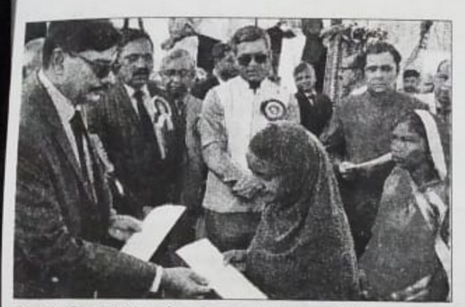
ातेहार में रविवार को परिसंपत्ती का वितरण करते मुख्य न्यायाधीश।